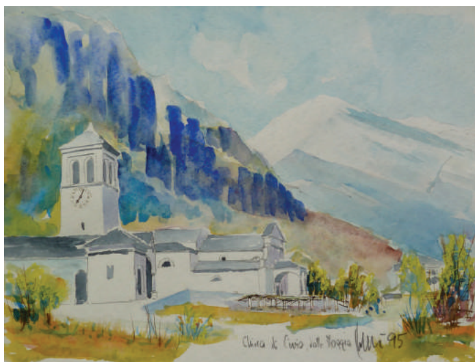
Chiesa di Cevio, Vallemaggia, 1995