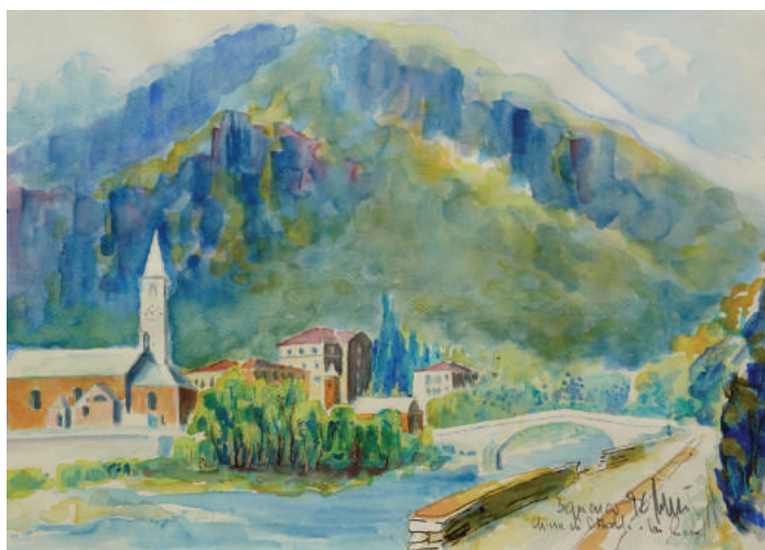
Bignasco, chiesa di S.Michele e S.Rocco, 1996